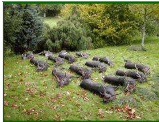
Strecke aus der Brunft

Bitte vergessen Sie Ihren gültigen Jagdschein nicht! Sie werden von Forstoberrat Bergen und seinen Beamten begrüßt, auf die jeweiligen Förstereien aufgeteilt und über den Ablauf der bevorstehenden Jagdtage unterrichtet. Anschließend haben Sie die Möglichkeit, Ihr Hotel-/Pensionszimmer zu beziehen.