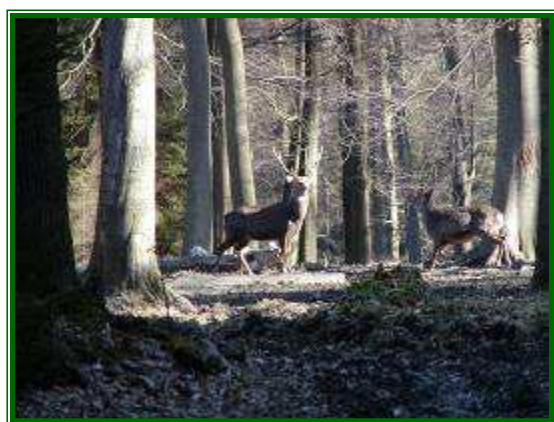
Sikahirsch und -tier

Die Geschichte des Forstamtes begann mit dem „Reichsdeputationshauptschluss“ vom 24. Februar 1803: Ludwig, Landgraf von Hessen-Darmstadt, wurde neuer Landesherr im kurkölnischen Sauerland. Verwaltung und Nutzung der Forsten kamen unter staatliche Kontrolle, eine nachhaltige Forstwirtschaft wurde in die Wege geleitet. Seit 1803 ist das ehemalige Gut Obereimer ununterbrochen Sitz einer Forstbehörde. 1815 fiel das Sauerland an Preußen. Aus der „Großherzoglich-Hessischen“ wurde die „Königlich-Preussische Oberförsterei“.